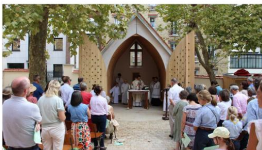
7 SEPTEMBRE 2025 : JOUR DE LA CANONISATION DE SAINT CARLO ACUTIS ET PREMIERE MESSE DANS L'ORATOIRE PAROISSIAL À SON NOM

Le mobilier liturgique sera réalisé progressivement, au fur et à mesure de la collecte.