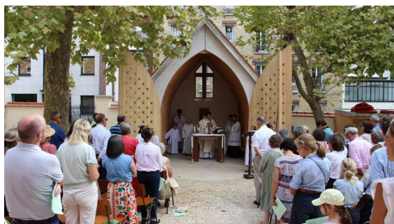
7 SEPTEMBRE 2025 : JOUR DE LA CANONISATION DE SAINT CARLO ACUTIS ET PREMIERE MESSE DANS L'ORATOIRE PAROISSIAL À SON NOM

Le mobilier liturgique sera réalisé progressivement, au fur et à mesure de la collecte.