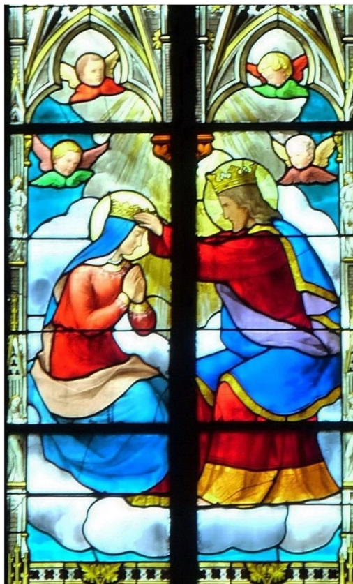
Couronnement de la Vierge, détail des vitraux de l'abside réalisés par Émile Hirsch en 1874