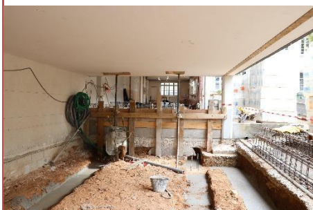
Salles de réunions