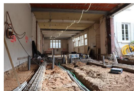
Salle St Joseph et salle du patronage