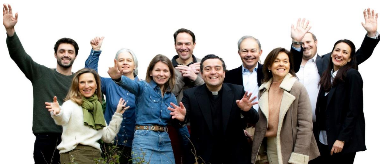
L'équipe du Village de Notre-Dame de Boulogne dynamique et engagée

Le café Poussette-Canne : sera un café associatif qui aura pour but de répondre à l'absence de lieu de vie destiné aux familles dans le quartier. Un lieu intergénérationnel d'échange et de convivialité. Un lieu d'accueil, de partage et d'apprentissage, ouvert à tous et pour tous où des activités socio-éducatives, culturelles, sportives et artistiques seront proposées. Ce café aidera également à la lutte contre l'isolement des jeunes mamans / papas / ou toute autre personne se sentant seule. Ouverture prévue en septembre 2024.